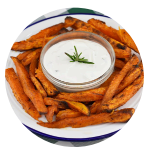
Cartofi dulci copti cu sos de iaurt