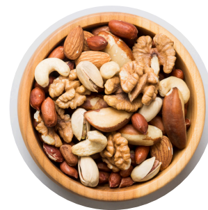
Diverse nuci sau semințe

Alimentele sănătoase conțin nutrienți care sunt importanți pentru creștere și dezvoltare în timpul pubertății