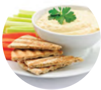
Bastonașe de legume cu humus