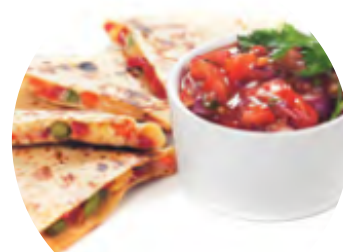
Lipie cu legume