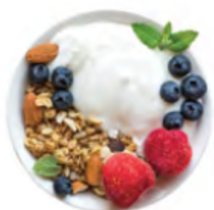
Iaurt cu fructe și semințe