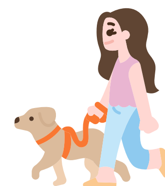
plimbat câinele în ritm rapid

Activitate fizică intensă: crește frecvența respirațiilor, vorbești greu în timpul ei.